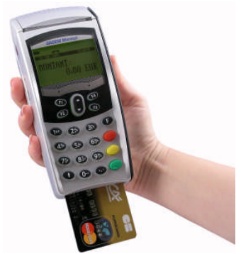
Logo Ticket CB client