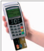
Carte à puce