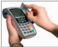
Carte à piste